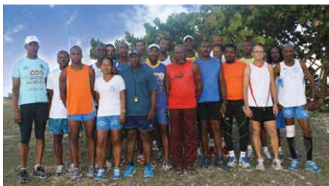
La Ville du Gosier bien représentée au Relais Inter Entreprises 2014 !

La ville du Gosier était représentée à la 17 e édition du Relais Inter-Entreprises DU 27 MAI 2014. Le moins que l'on puisse dire est que celle-ci a atteint une place tout à fait honorable, au sein du top 10. Les relayeurs du Gosier ont en effet décroché, avec un temps de 04h07, une 8 ème place qui honore notre ville. Félicitations à eux !