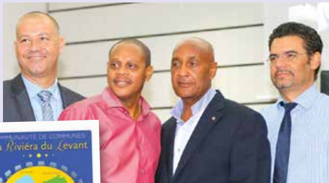
Les membres dirigeants du Conseil Communautaire de la Riviera du Levant :

Le conseil communautaire va devoir ainsi définir son projet de territoire et l'intérêt communautaire afin d'élargir le champ d'intervention de la communauté.