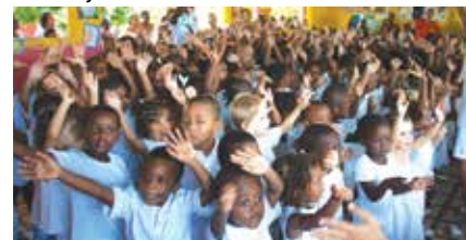
Les enfants de maternelle

Quant à l'école d'aujourd'hui et l'éducation en général, l'avis de Madame la Directrice est assez simple : « On doit respecter l'école parce que c'est une institution. C'est un endroit où doit régner la sérénité, une ambiance de respect des choses et des gens, pour les adultes comme pour les enfants ! » Or, aujourd'hui, « les jeunes parents ont tendance à laisser faire. Je pense que cela nous posera un problème d'ici une dizaine d'années. C'est au quotidien qu'il faut attirer leur attention et leur parler pour les aider, les accompagner. Mon travail, c'est de travailler pour les enfants du Gosier et de la Guadeloupe. Je suis assez fière quand je rencontre certains de « mes » enfants devenus experts comptables, esthéticienne, ingénieur. Nous n'aurions plus d'élite si nous, éducateurs, ne faisons plus notre travail ! Le rôle de l'école, c'est d'élever le niveau. C'est ce pour quoi je me suis toujours investie ».