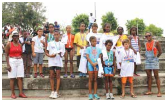
De nombreux enfants ont participé au championnat