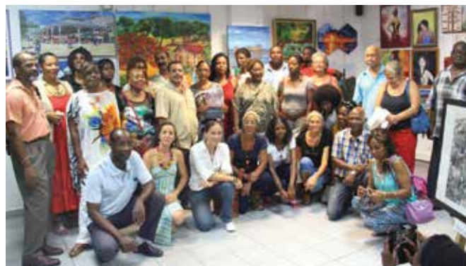
L'ensemble des exposants prend la pose

Cette soirée inaugurale a été complétée par un happening du plasticien Thierry LIMA. Sous le regard attentif du public, celui-ci a conçu une œuvre qui, installée sur le parvis de la médiathèque a signalé l'exposition jusqu'au 24 mai, date de sa clôture.