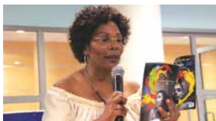
Des déclamations passionnées