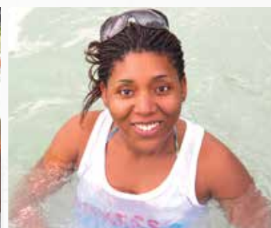
Une Adjointe au Maire qui donne l'exemple !