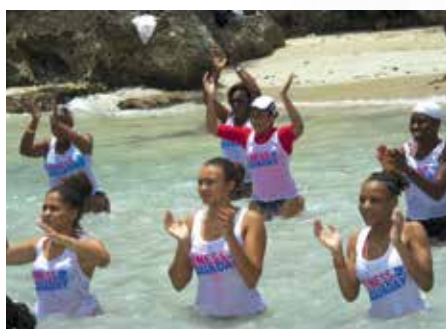
Le sport, c'est la santé !