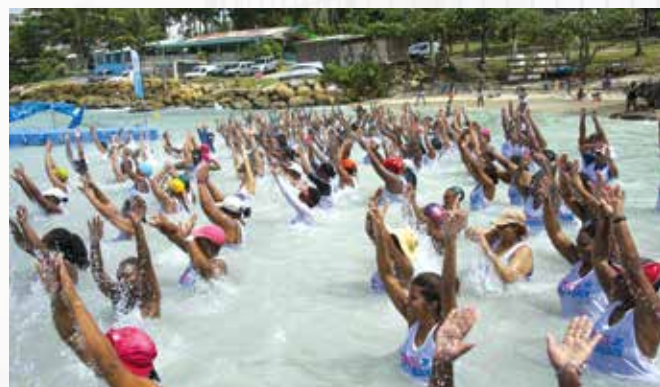
Sous la houlette du moniteur, les participants ne font plus qu'un !