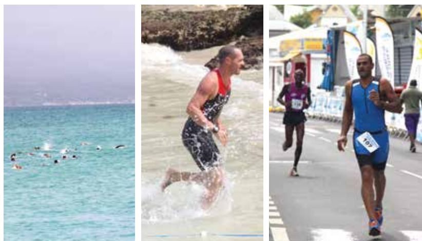
L'aquathlon, une discipline alliant natation et course à pied