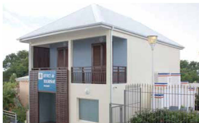
Office de Tourisme du Gosier : 0590 84 80 80 - otdugosier@gmail.com

En plus de ce support bimestriel, l'équipe de l'office se délocalise pour se rapprocher des visiteurs en offrant un accueil de qualité et des conseils pour découvrir ou redécouvrir les îles de Guadeloupe. Bref, une équipe dynamique et souriante à votre service !