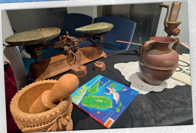
De nombreux objets d'époque.